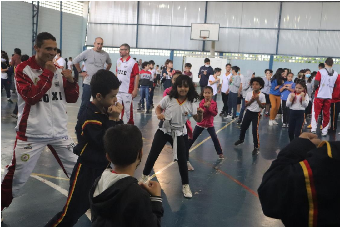
Foto 7 – Momento de prática do boxe junto aos alunos da Escola Municipal: “Flavio de Souza Nogueira”, no programa LISOBXO NAS ESCOLAS, em parceria com a Secretaria de Esportes e Qualidade de Vida e Secretaria da Educação.