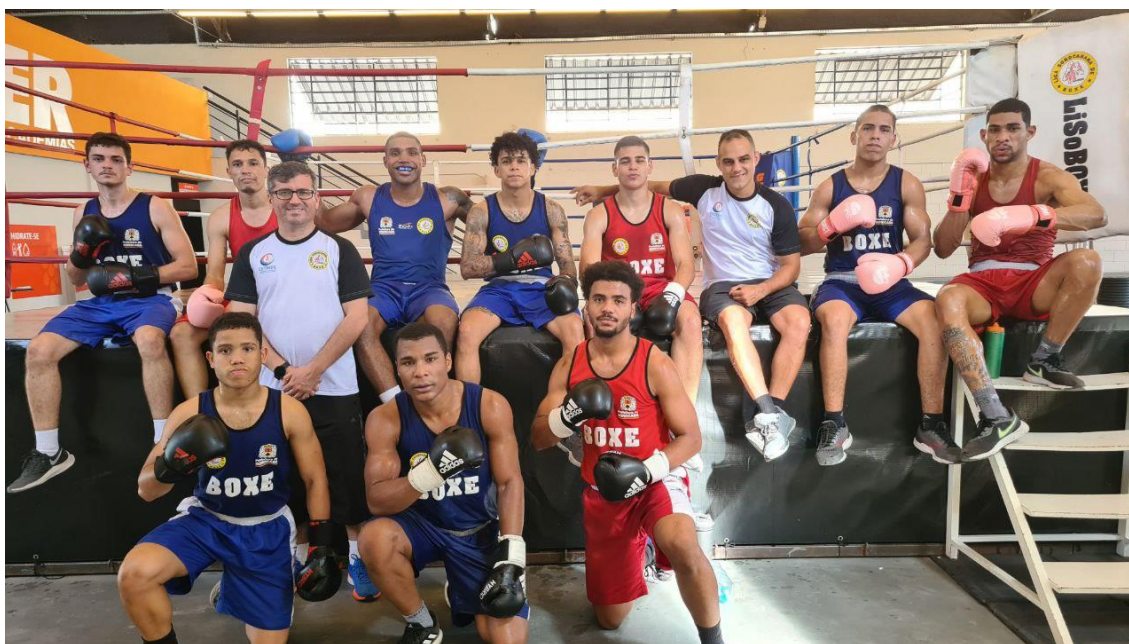
Foto 1 – Equipe de boxe sorocabana posando para foto depois de um treino especial de sparring, no Centro de Treinamento da LISOBXO.