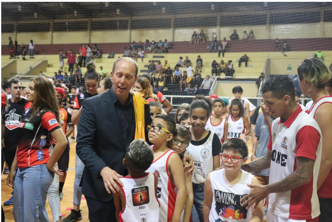
Foto 4 – Equipe de boxe sorocabana e alunos do projeto social, participando da abertura do Cruzeirão 2022.