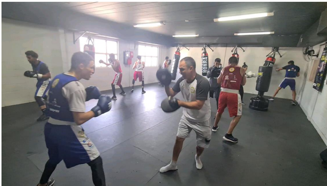
Foto 8 – Treinamento técnico da equipe de boxe com exercícios específicos para coordenação e precisão de golpes.