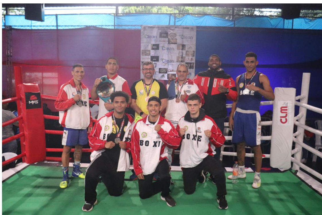
Foto 2 – Equipe de boxe sorocabana após a conquista do Cinturão Newton Campos, torneio realizado na capital.