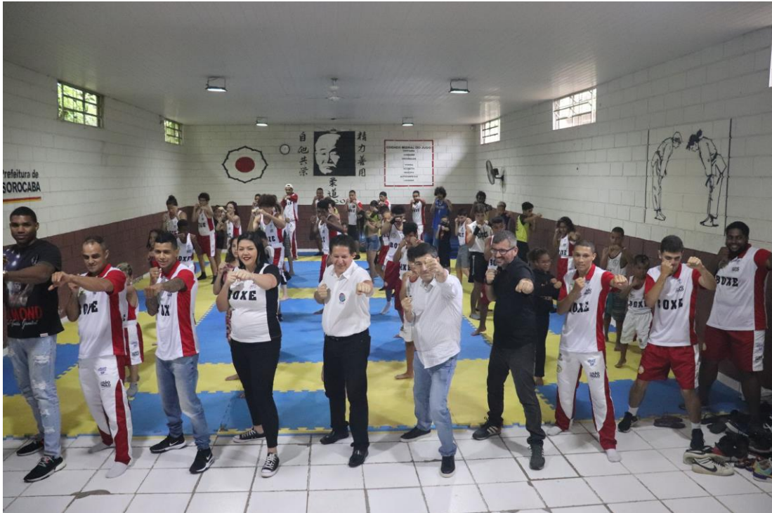
Foto 3 – Inauguração do projeto social BOXE: uma luz para o futuro, no Centro Esportivo Maria Eugênia, com presença do secretário municipal de esporte e do secretário estadual de esportes e toda a equipe de professores LISOBXO.