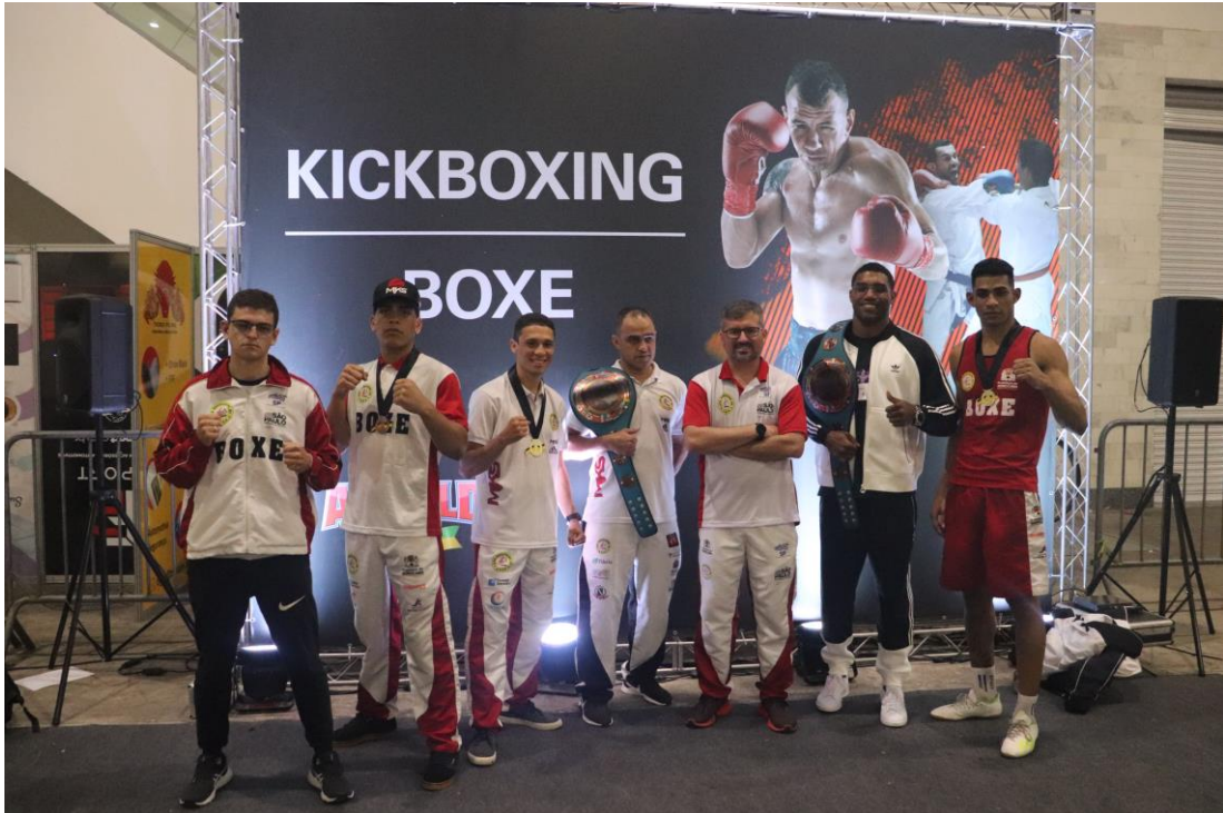
Foto 5 – Equipe de boxe sorocabana após a conquista do Arnold Open Boxe, torneio realizado na capital.